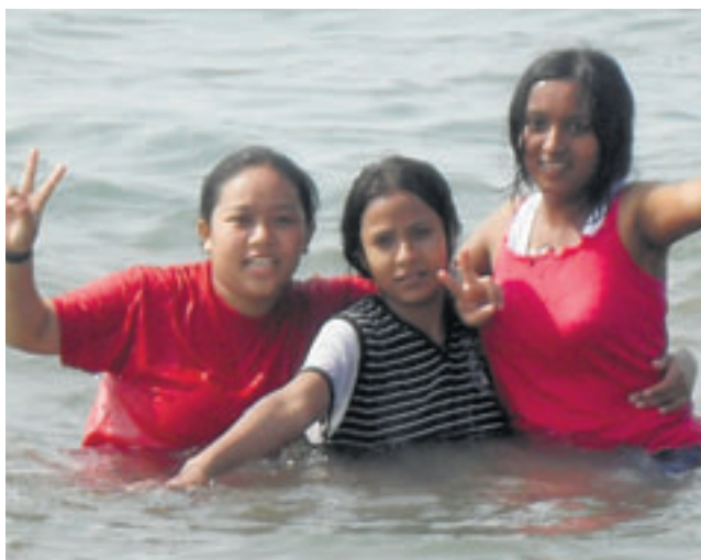
An einem ihrer wenigen freien Tage macht die Medizinstudentin auch dieses Jahr einen Ausflug ans Meer.

seren grossen Ausflug ans Meer. Auch dieses Mal war er wieder ein Erlebnis für mich und meine Kollegen und Kolleginnen.